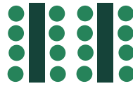
Tischreihen 40 Personen