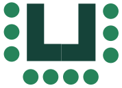
U-Form 20 Personen