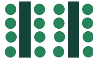
Tischreihen 40 Personen