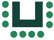
U-Form 20 Personen